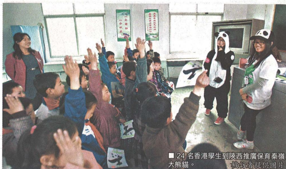
■ 24名香港學生到陝西推廣保育秦嶺大熊貓。