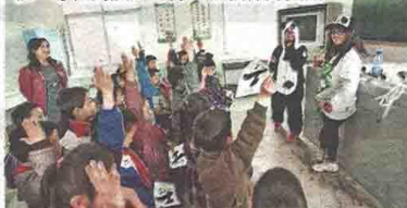
本地大學生到陝西佛坪縣學校推廣，學生表現雀躍。

說父親停止破壞生態，最終建議學生其實可鼓勵父親發展生態旅遊取代伐木賺錢，發展經濟同時，亦不破壞環境。」