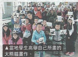
▲當地學生高舉自己所畫的大熊貓畫作。