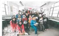
海洋公園保育基金熊貓行動其中一個重要理念是「播種」——宣揚保育概念。教院學生到佛坪的中小學講課，以活動形式宣揚保育。

【明報專訊】中國國寶熊貓惹人喜愛，你有想過如何保育瀕臨絕種的熊貓嗎？來自香港浸會大學和香港教育學院的學生，參加由Citywalk荃新天地與香港海洋公園保育基金合辦的「關愛、大熊貓2013」計劃之陝西大熊貓保育之旅，推廣保育信息，告訴大家原來每人改變一些生活習慣，就可以為保育出一分力！