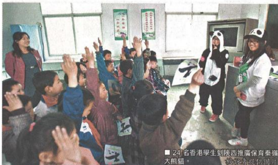
■ 24 名香港學生到陝西推廣保育秦嶺大熊貓。

Date: 17 April, 2013 Publication: Apple Daily Page: A21