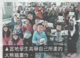
▲當地學生高舉自己所畫的大熊貓畫作。