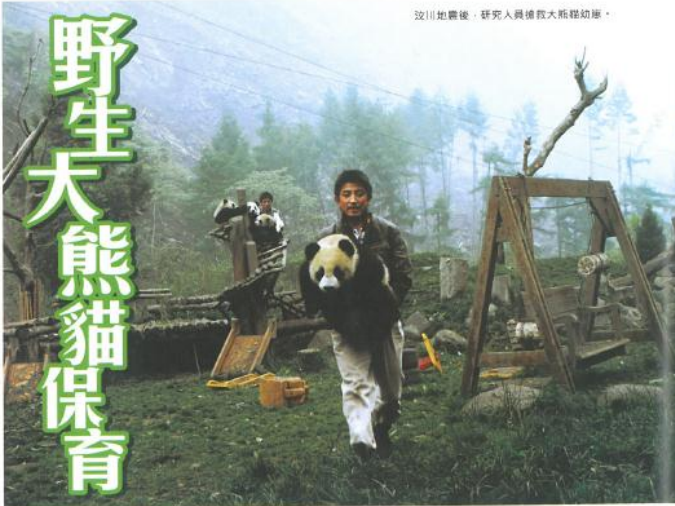
汶川地震後，研究人員獲救大熊貓幼崽。