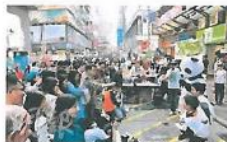
「大熊貓」現身旺角街頭與市民互動，並與小朋友大玩注入保育元素的遊戲，吸引大批途人圍觀。

24名來自香港浸會大學和香港教育學院的學生於2013年3月29日至4月4日期間，隨海洋公園保育基金前往陝西佛坪縣國家級自然保護區，進行教學及社區宣傳活動。旅程之前，浸大學生已於3月初起到香港街頭宣傳，在旺角鬧市、校園等地，以短劇、遊戲的形式宣傳保育信息。