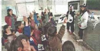
本地大學生到陝西佛坪縣學校推廣，學生表現雀躍。