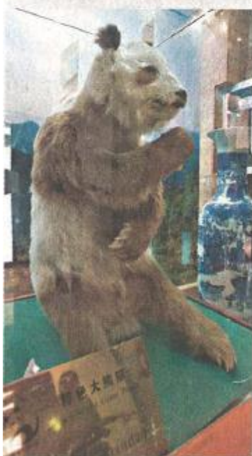
■ 秦嶺大熊貓胸斑暗棕及黑白色，腹毛棕色；圖為首次被發現的秦嶺大熊貓標本。