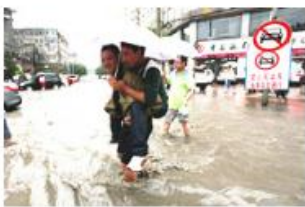
西安遭遇强降雨 多处路段能“看海”

来源: 陕西传媒网-陕西日报 2013年04月18日 06:07 字号: T|T